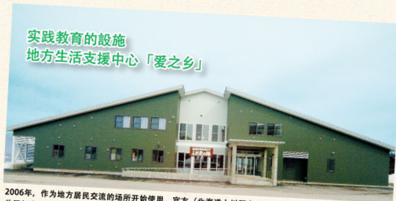
实践教育的设施 地方生活支援中心「爱之乡」

2006年，作为地方居民交流的场所开始使用。官方（北海道上川郡东川町）与民间（北工学园）共同努力以谋求地区福利事业的发展。作为本学园的教育、实践设施，学生以地区支援专员的身份接触从幼儿到高龄者，身体障碍者等地区居民，是学习技能、磨练身心的地方。