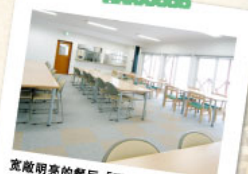
宽敞明亮的餐厅「爱之乡」