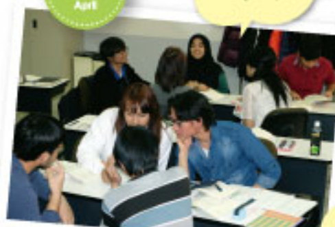
团队合作小组 学习