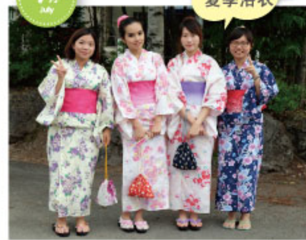
焰火大会 上穿上了 夏季浴衣