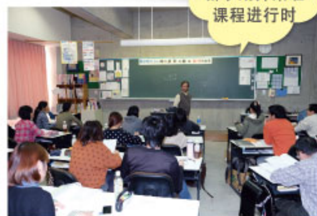
新学期开始啦 课程进行时