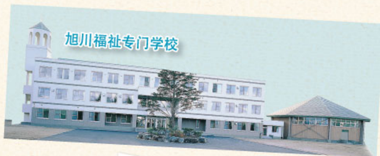
旭川福祉专门学校