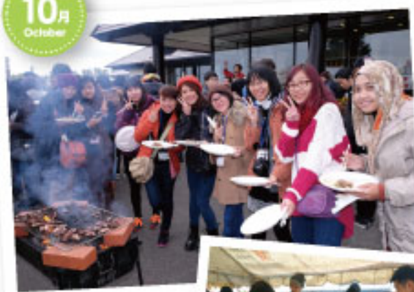
东川町居民 来欢迎新生