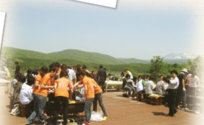
餐厅旁的木制平台→