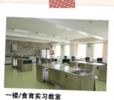
一楼/食育实习教室